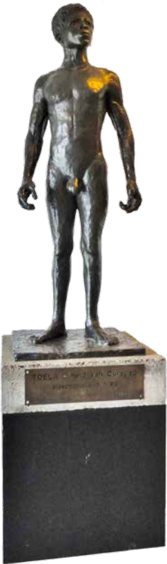
Toos Hagenaars' beeld van 'Toela, de held van Curaçao' bij de slavenopstand van 1795, in De Klinker te Winschoten.

In Oost-Groningen staat een beeld. Een bronzen standbeeld van een rijzige, naakte Afrikaanse gestalte. 'Toela – held van Curaçao. Slavenopstand 1795', staat er op de sokkel, die ook de maakster noemt: 'beeldhouwer Toos Hagenaars (hier woonachtig)'. Na enige omzwervingen over de wereld heeft het beeld sinds 2015 een definitief onderdak gevonden in het Cultuurhuis De Klinker. Een paar straten verderop, tegen de muur van het oude gemeentehuis van Winschoten, zit de 'zoon van Toela', ook van Hagenaars' hand en eveneens in brons gegoten: een afwachtend kind met zijn benen wijd en zijn handen in elkaar gevouwen op zijn knieën. In de winter wordt hij soms bedekt door een witte donsdeken. De kunstenaar heeft hem een bronzen broekje aangetrokken. In 1980 werd het werk bekroond met de Publieksprijs Groningen Monumentaal. Desondanks, en ongeacht de prominente plaatsen die beide beeldhouwwerken uiteindelijk kregen toebedeeld, weten maar weinigen buiten (en ook binnen) Winschoten over de geschiedenis waar deze beelden naar verwijzen – en over de geschiedenis van de beelden zelf. 1 Dat is ook niet zo verwonderlijk: de koloniale geschiedenis en de slavernij die daar deel van uitmaakte worden niet snel met Oost-Groningen in verband gebracht. Toch herinneren deze tastbare verwijzingen naar de voorman van de Curaçaose slavenopstand van 1795 aan een slavernijverleden dat ook in de Groningse samenleving sporen heeft achtergelaten.