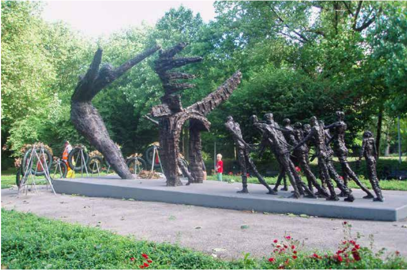
Erwin de Vries, Nationaal monument slavernijverleden, Oosterpark Amsterdam. Dit werk herdenkt de afschaffing van de slavernij in het Koninkrijk der Nederlanden, 1863.

premier Jan Peter Balkenende. In 2006 deed hij tijdens de Algemene Beschouwingen een oproep om 'optimistisch' te zijn: 'Laten we zeggen: Nederland kan het weer! Die VOC-mentaliteit, over grenzen heen kijken, dynamiek!' Waar hij direct, na enig gegeneerd gegniffel vanuit de parlementaire bankjes, op liet volgen 'Toch?' 11 Die gêne hing samen met het toen actuele debat over de keerzijde van deze zogenaamde VOC-mentaliteit: het geweld waarmee de verovering en uitbating van nieuwe gebieden gepaard was gegaan. Dat debat had bijgedragen aan de opdracht voor een 'Nationaal monument slavernijverleden' ter herdenking van de afschaffing van de slavernij in het Nederlands Koninkrijk in 1863, dat op 1 juli 2002 werd onthuld in het Oosterpark te Amsterdam. Het was een zichtbaar teken waarmee de Nederlandse overheid, bij monde van de toenmalige Koningin Beatrix, een historisch bewustzijn wilde bevorderen over 'de schaduwkant' (lees: moord en doodslag) van de Nederlandse expansiedrang. 12